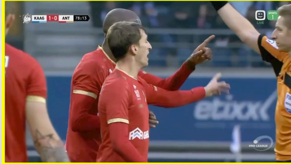
Joueur venant avec véhémence protester une décision