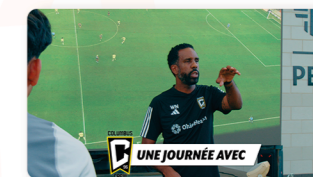
Des reportages inside