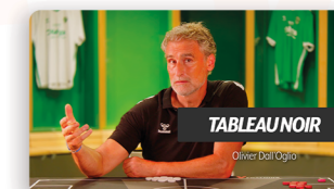
Des conseils tactiques