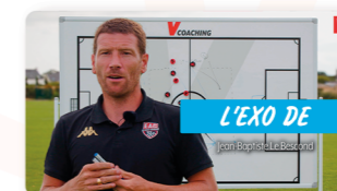
Des contenus partagés