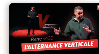
Des conférences premium