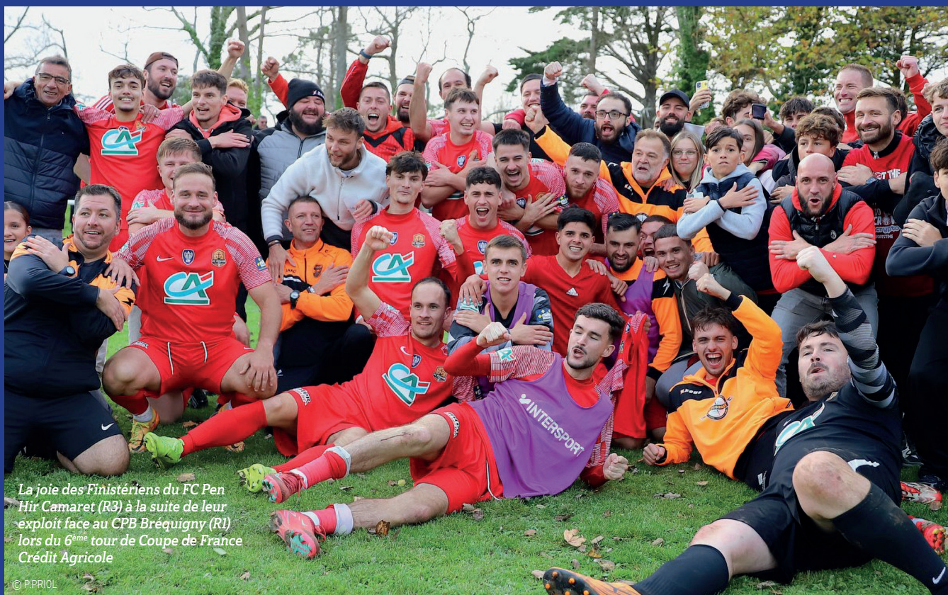
La joie des Finistériens du FC Pen Hir Camaret (R3) à la suite de leur exploit face au CPB Bréquigny (R1) lors du 6 ème tour de Coupe de France Crédit Agricole