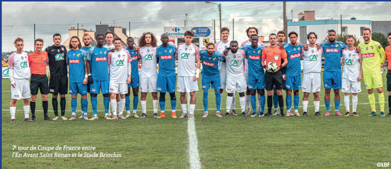
7 e tour de Coupe de France entre l'En Avant Saint-Renan et le Stade Briochin